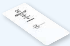
JK091 95 × 215 мм

Многоразовый фильтр Aescular®, рассчитан на 1000 стерилизационных циклов. Упаковка 2 шт.