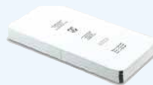
JF166 118 × 235 мм

Многоразовый фильтр Aescular®, рассчитан на 1000 стерилизационных циклов. Упаковка 2 шт.