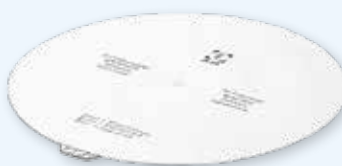
JK095 ø 190 мм

Многоразовый фильтр Aescular®, квадратный, рассчитан на 1000 стерилизационных циклов. Упаковка 10 шт.