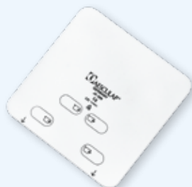
JK089 225 × 225 мм

Многоразовый фильтр Aescular®, круглый, рассчитан на 1000 стерилизационных циклов. Упаковка 10 шт.