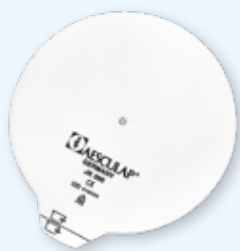
JK090 ø 190 мм

Многоразовый фильтр Aescular®, круглый, рассчитан на 1000 стерилизационных циклов. Упаковка 10 шт.