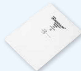
JF481 230 × 230 мм

Бумажный одноразовый фильтр Aescular® с индикатором, класс I. Упаковка 100 шт.